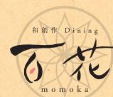
和創作 Dining 百花